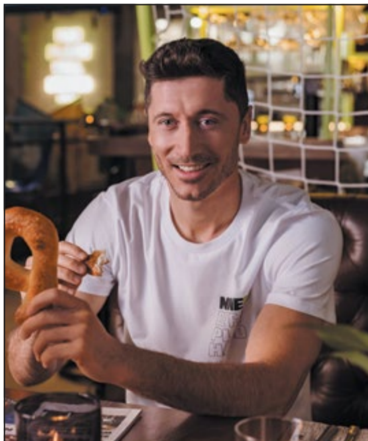
BE OUR BIGGEST FAN. Robert Lewandowski z Drużyną NINE'S

Jesteś w miejscu, które ma być prawdziwą Świątynią Sportu. Tu legendą są wszyscy Ci, którzy inspirują nas każdego dnia w drodze do wyznaczonego celu. Chcemy im podziękować za zaangażowanie, wytrwałość i motywację. Bo niezależnie czy wygrasz, czy przegrywasz, pamiętaj, że doskonałą motywacją w drodze do wyznaczonego celu są inni ludzie - tacy, którzy ten cel osiągają. Zapraszamy Cię do naszej drużyny i wspólnego tworzenia wyjątkowego miejsca pełnego zdrowych emocji - nie tylko tych na murawie. Niech NINE'S będzie początkiem naszej wspólnej przygody w duchu sportu i zdrowej rywalizacji.